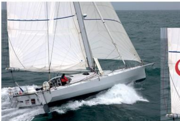
A partir d'une photographie ...

formation réalisée pour l'agence de communication SailingOne