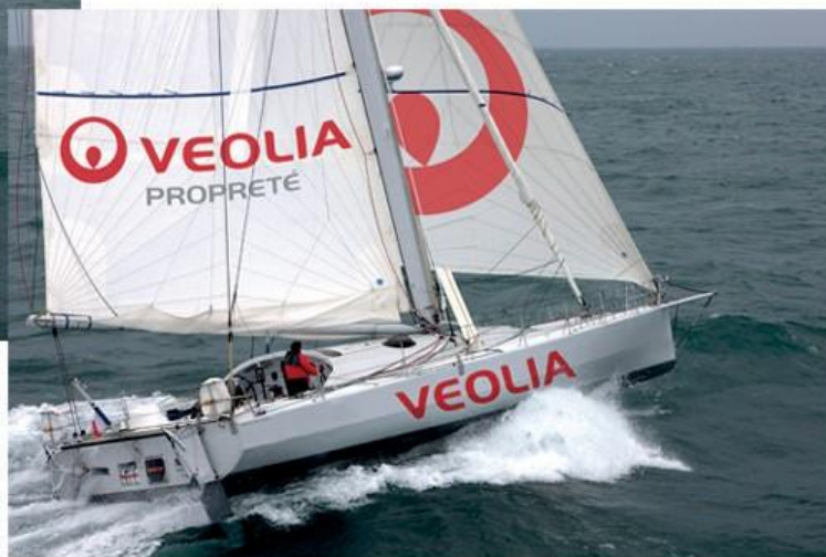
réalisation d'un marquage de voiles et de coque